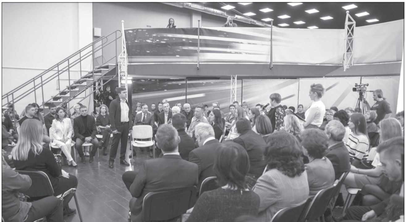
Диалог губернатора с жителями области.

ске, дороги в с. Толпыгино, в Фёдоровцах, Рождествене и др. Наконец-то жители ул. Революционной получили возможность ходить по ровному тротуару, он проложен от Василёвского парка до парикмахерской «Куаффюр». В следующем году его строительство будет продолжено до здания полиции. И если в этом году на дорожные работы было потрачено 12,5 млн. руб., то в следующем планируется 29 млн. Народ уже привыкает к хорошим дорогам, и это правильно.