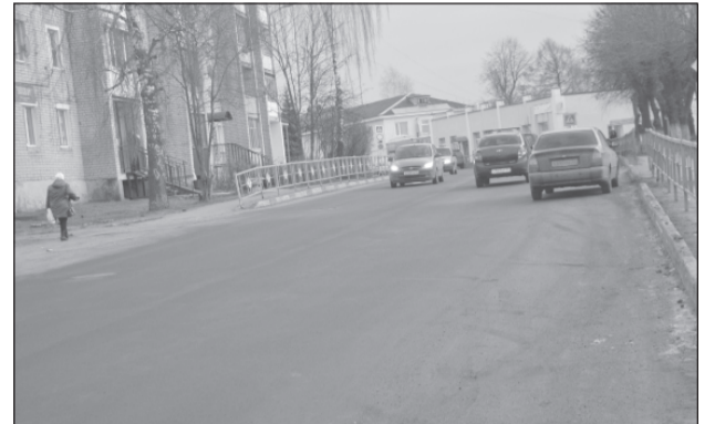
Так ровно и гладко выглядит трасса на ул. Революционной после капремонта