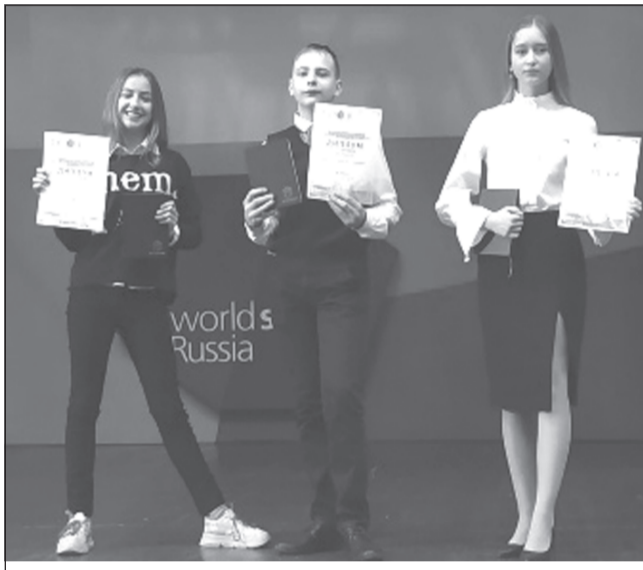
Эти ребята уже сделали свой шаг в будущее

В г. Липецке завершились Федеральные окружные соревнования научной молодежи «Шаг в будущее, Центральная Россия», посвященные 185-летию со дня рождения Д.И. Менделеева.