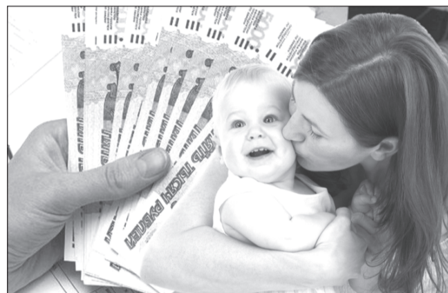
С появлением малыша расходов прибавилось, выплаты не мешают

Выплата назначается на год. Далее продлевается до достижения ребенком возраста трех лет с ежегодным под-