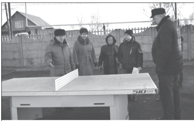
Комиссия рассматривает теннисный стол нового образца

К двум имеющимся спортивным площадкам, в саду «Текстильщик» и в молодёжном парке на месте бывшей СЮТ, прибавилась ещё одна – на городском стадионе.