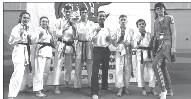
Ждём от воспитанников клуба «Молодые ветра» новых побед

В Перми состоялся Чемпионат России по каратэ СКИФ, в ходе которого проводился отбор спортсменов на Чемпионат Европы.