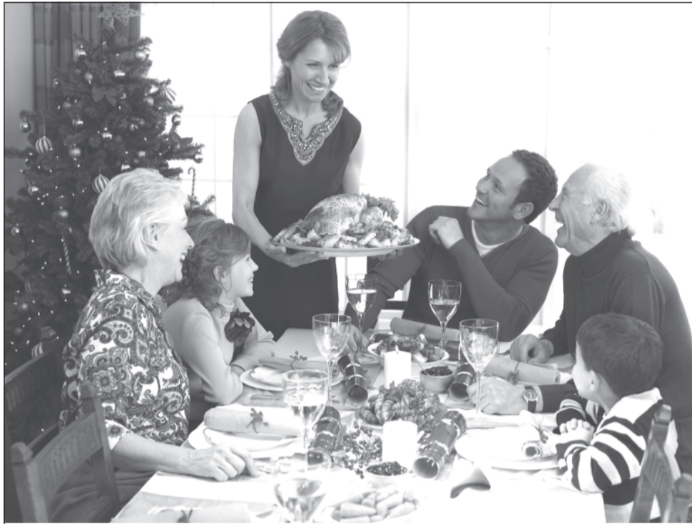
Встречаем праздник в хорошей компании и с хорошим настроением

Довольно простой вопрос — в чем встречать Новый год 2020, может сбить с толку даже самую заядлую модницу. Здесь важно знать, что Крыса не любит сложных силуэтов, рюшей, бантов и прочей мишуры. Для празднования Нового года лучше