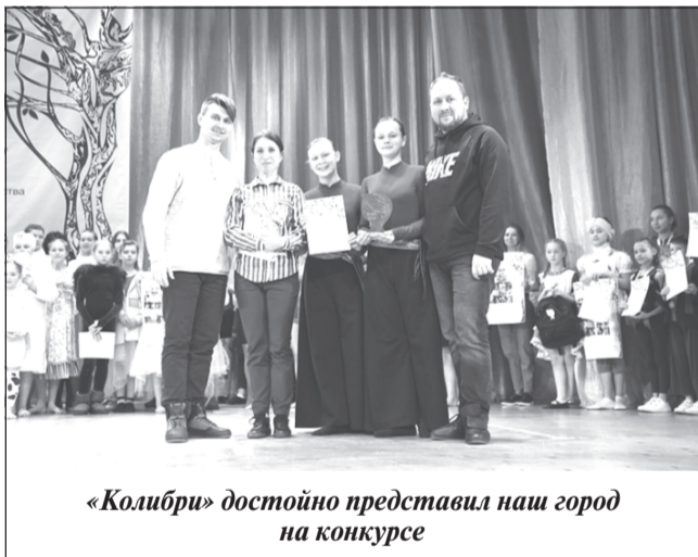
«Колибри» достойно представил наш город на конкурсе

«Ветви» - так называется всероссийский конкурс-фестиваль хореографического искусства, организованный Центром развития творчества детей и юношества «Танцы +».