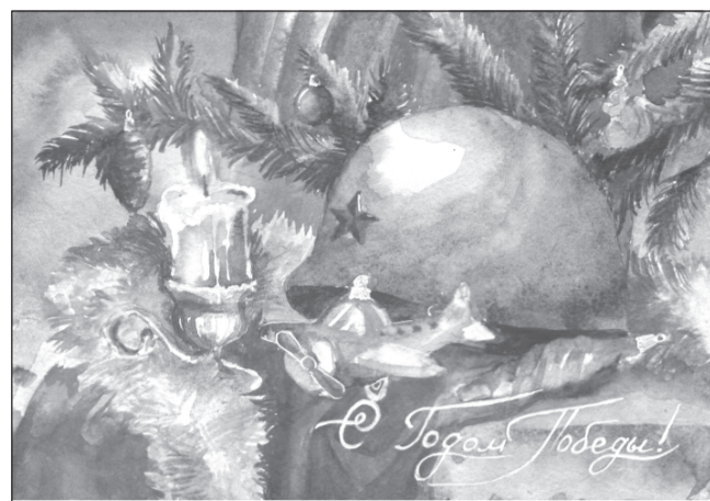
«Ёлка Победы» от ивановской школьницы

Рисунки 10 победителей используют для создания коллекционной серии новогодних открыток, которую выпустит Почта России. Также лауреаты станут участниками квеста «Елка