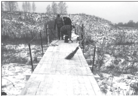
Мост, по которому не страшно пройти

Благодаря совместным усилиям местной приемной и администрации Ингарского сельского поселения важный для жителей объект обустроили в декабре.