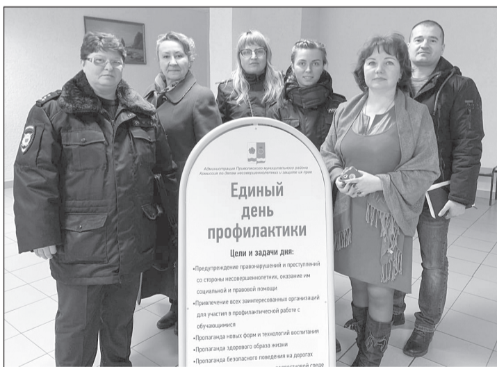
Студентам необходимо знать о том, за что наступает административная ответственность

В рамках Единого дня профилактики прошли беседы с учащимися Плесского колледжа бизнеса и туризма, в которых принимали участие сотрудники ГИБДД, ПДН, уголовно-исполнительной инспекции, сотрудники уголовного розыска.