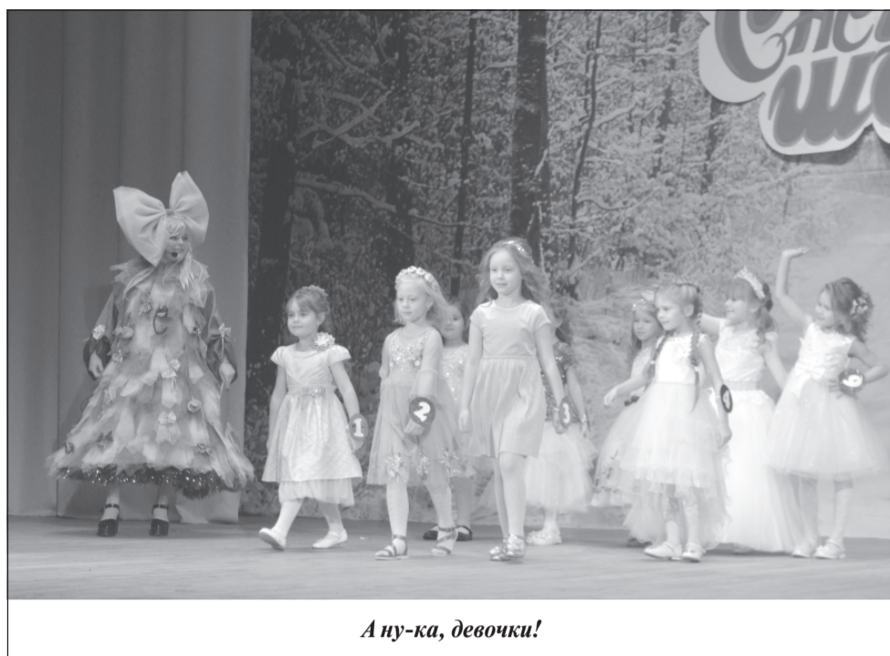
А ну-ка, девочки!